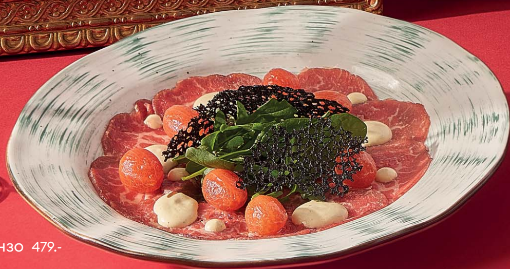
Карпаччо ди манзо 479.- Beef carpaccio

Тонкие слайсы филе говядины, очищенные помидоры черри, листья салата и сливочно-горчичный соус. Украшаем чёрными кружевными чипсами и каплями бальзамического уксуса